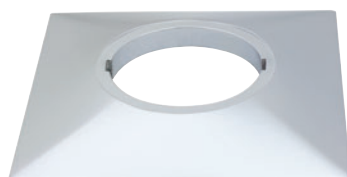
Chrom matt Chrome mate Chrom mat EAN 4000870 987797 987.79