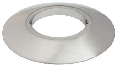
Eisen gebürstet Acier brossé Staal geborsteld EAN 4000870 987810 987.81

De eerste inbouwlamp die (bijna) niet ingebouwd hoeft te worden! Dankzij supermoderne LED-techniek is deze lamp buitengewoon plat. In combinatie met een speciale opbouwring is zelfs een diepte van 0 mm (!) mogelijk. Op parket, tegels, laminaat of vloerbedekking: De UpDown-Light LED kan overal worden ingezet; ook geschikt om naderhand verlichting aan te brengen. Omdat LEDs op hele lage spanning werken, kunnen de beldraden die voor de installatie noodzakelijk zijn (5 m inclusief) in hele kleine tussenruimtes worden gelegd (bijv. tegelvoegen, vloerbedekkingsranden of tussen messing en groef van houten panelen). De gebruiksduur van de LEDs bedraagt 100.000 uur. Daarbij geven ze praktisch geen warmte af en kunnen zonder risico met blote voeten worden betreden. Door de beveiligingsklasse IP 67 kunnen ze in vochtige ruimtes en op beveiligde plaatsen buitenshuis ingezet worden. Er bestaat geen gevaar voor warmteopbouw voor isolatiematerialen in plafonds en wanden.