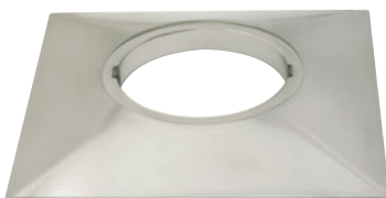
Eisen gebürstet Acier brossé Staal geborsteld EAN 4000870 987827 987.82