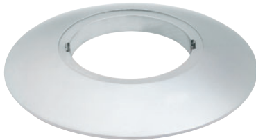
Chrom matt Chrome mate Chrom mat EAN 4000870 987773 987.77