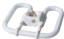
Hřejivá bílá Ciepłobiały Tёплый Белый