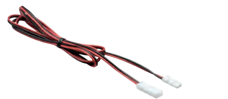
Adapter JST 1x1m, 350, 500, 700, 1000, 1400mA (2x0,5mm 2 )

⇔1 m EAN 4000870 002339 233 3,47 3,03 2,89