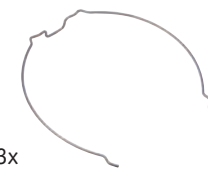
3x ø51 mm EAN 4000870 937624 937.62 0,72 0,63 0,60