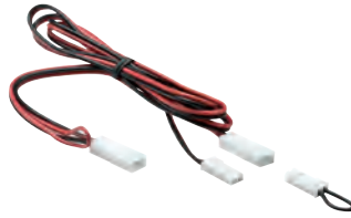
Adapter JST 1x1m, 350, 500, 700, 1000, 1400mA (2x0,5mm 2 )

⇔1 m EAN 4000870 002292 229 4,55 3,98 3,79